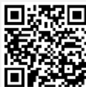
คู่มือการใช้งาน e-Voting