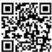
คู่มือการใช้งาน e-Request